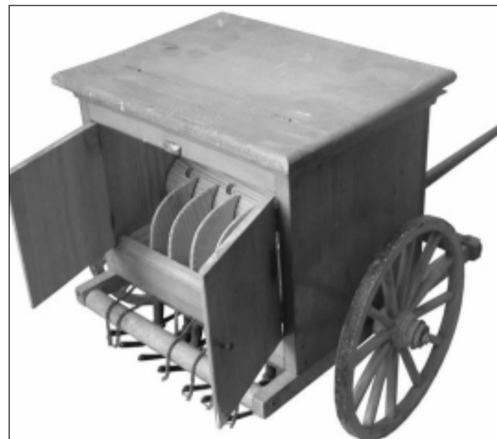
Una de las maquetas expuestas. S.E.

Esta exposición, de la escuela de pintura de Fernando Sanagustín, se puede contemplar en el Centro Cultural Matadero hasta el próximo 28 de junio.